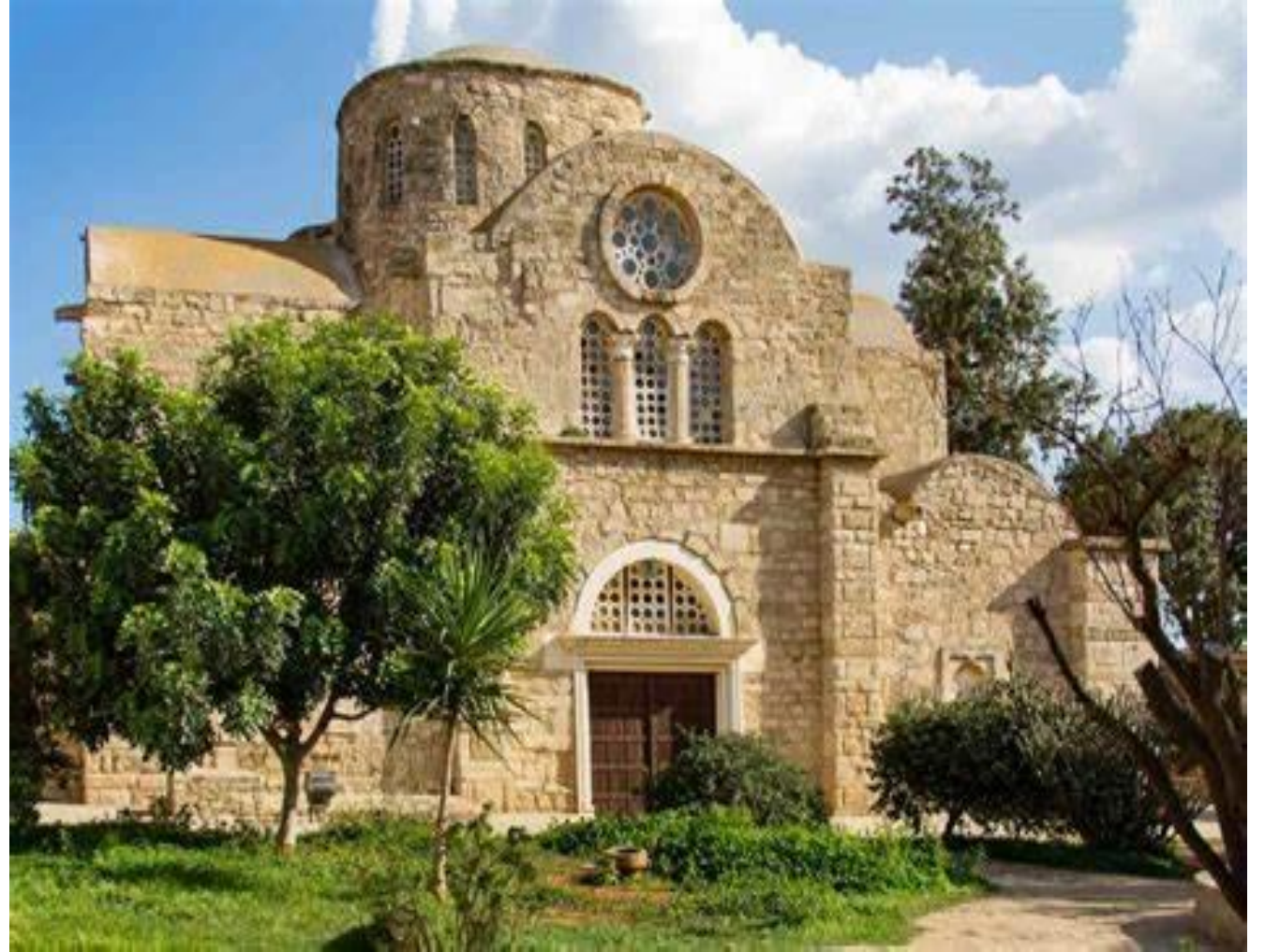
Η εκκλησία του Αποστόλου Βαρνάβα στην κατεχόμενη Σαλαμίνα της Κύπρου

Αυτό έκαναν έσκαψαν και βρήκαν το σώμα του Αποστόλου Βαρνάβα και το ευαγγέλιο του Χριστού πάνω στο σώμα του. Τότε πήγαν στον αυτοκράτορα Ζήνωνα στην Κωνσταντινούπολη και του πήραν το ευαγγέλιο. Εκείνος κατάλαβε ότι η εκκλησία της Κύπρου είναι Αποστολική και είπε ότι πρέπει να είναι ανεξάρτητη να αποφασίζει εκείνη αυτά που θέλει. Μάλιστα ο αυτοκράτορας έδωσε και πολλά χρήματα στους κύπριους για να κτίσουν μια εκκλησία για τον Απόστολο Βαρνάβα τον ιδρυτή της εκκλησίας τους. Η εκκλησία αυτή κτίστηκε αλλά τώρα είναι κατεχόμενη από τους τούρκους.